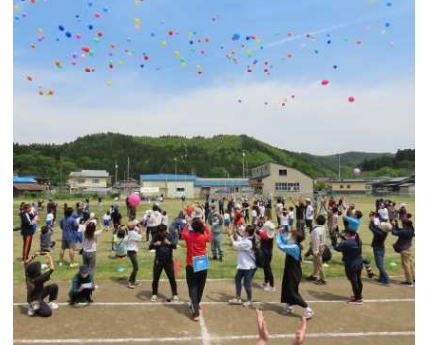
晴天に舞った 150個のバルーン