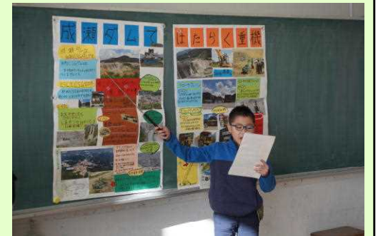
自信に満ちた発表!

自分の好きなことなどに果敢に挑戦する東小っ子が、ますます増えることを期待しています。