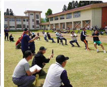
東大三学部の企画・運営 地区対抗 綱引き大会