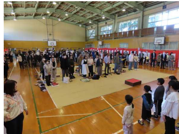
みんなで校歌一番を合唱