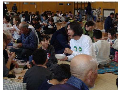
ふかわりょうさんもだまご鍋を満喫!