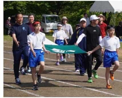
保護者や中学生も一緒に入場行進