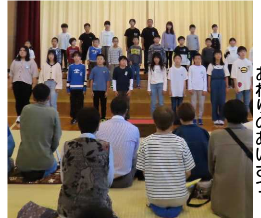
六年生全員による おわりのあいさつ