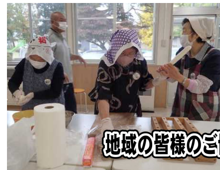
地域の皆様のご協力のおかげで、最幸の1日となりました!!