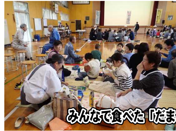
みんなで食べた「だまこ鍋」はおいしかったなあ!!