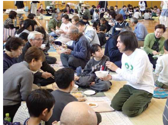
「ふかわりょうさん 初めて食べただまこ鍋は おいしかったなあ」